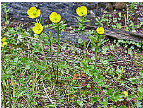
Snøsoleie opptrer spredt i østlige fjellstrøk og ble i 2007 registrert flere steder i Veiskiområdet og på Nordfoldaksla.