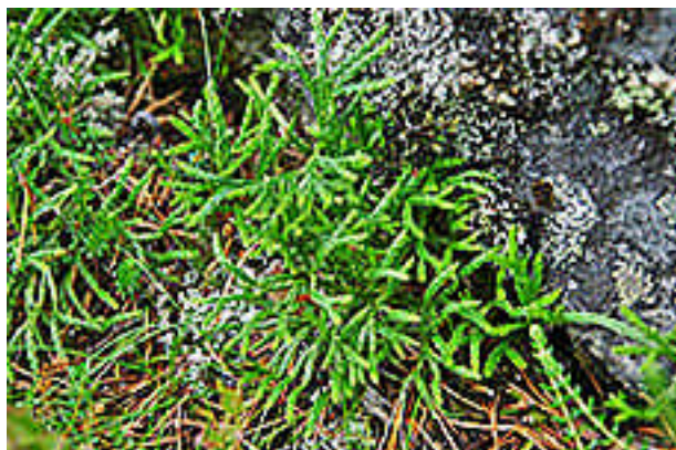
Skogjamne er en sjelden art i Salten, som ble funnet på ryggen mellom Sildhopvatnet og Mørsvikvatnet.