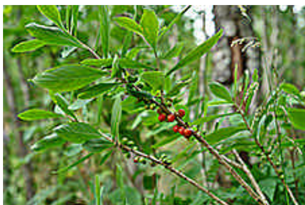
Tysbast har sin nordgrense i Norge ved Leirfjorden i Sørfold. Dette eksemplaret ble funnet på Kvarv.