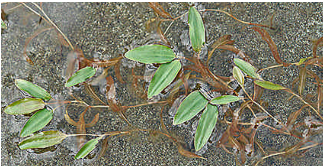
I 2007 ble grasstjønna funnet ett sted i Sørfold, i Aspfjordvatnet. Arten er tidligere bare kjent fra en lokalitet i Sørfold, men opptrer spredt gjennom hele Salten.