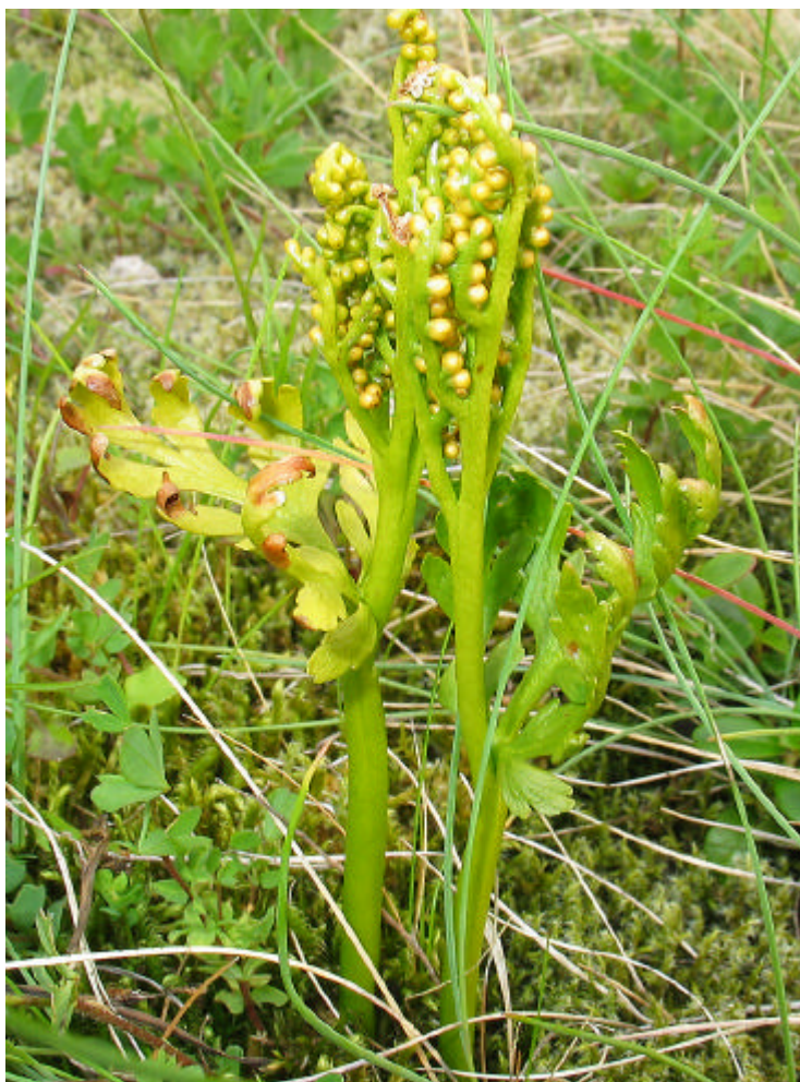
Den sjeldne rødlistearten håndmarinøkkel ( Botrychium lanceolatum ) ble funnet for første gang i Steigen.

Feltlagene brukte GPS-instrument for måling av nøyaktig UTM-koordinater under registreringsarbeidet.